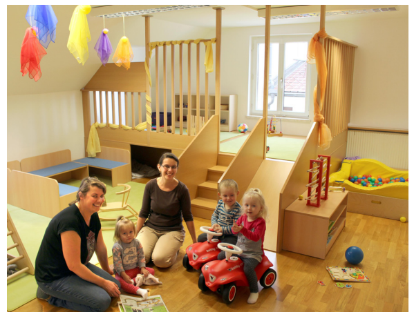
Foto: neue Krabbelstube